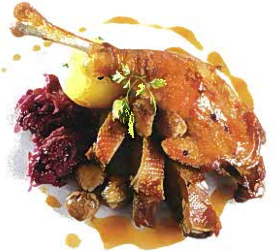
Wir wünschen Ihnen einen guten Appetit.

Nun bleibt noch Aufkochen und abschmecken und die Gans mit Rotkohl anrichten.